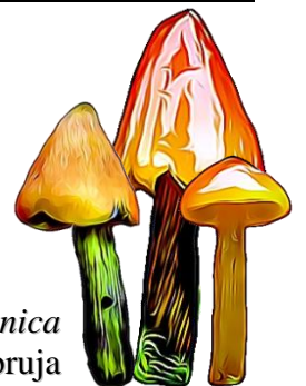
Hygrocybe conica Sombbrero de bruja

Phylum: Basidiomycota Clase: Agaricomycetes Orden: Agaricales Familia: Hygrophoraceae Género: Hygrocybe