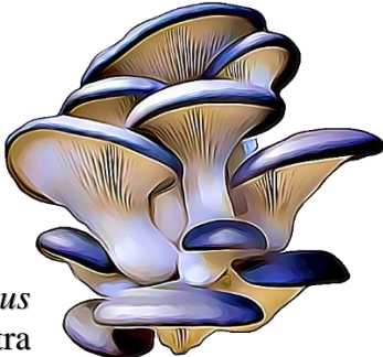
Pleurotus ostreatus Champiñón ostra

Phylum: Basidiomycota Clase: Agaricomycetes Orden: Agaricales Familia: Pleurotaceae Género: Pleurotus