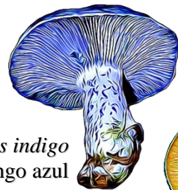
Lactarius indigo Hongo azul