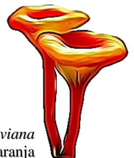
Omphalina vesuviana Omphalina naranja

Phylum: Basidiomycota Clase: Agaricomycetes Orden: Agaricales Familia: Tricholomataceae Género: Omphalina