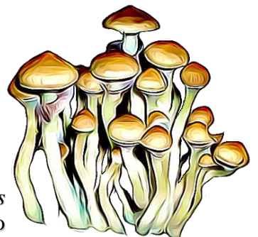
Psilocybe cubensis Cucumelo – Hongos de San Isidro