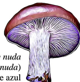
Clitocybe nuda (= Lepista nuda ) Seta de pie azul

Phylum: Basidiomycota Clase: Agaricomycetes Orden: Agaricales Familia: Tricholomataceae Género: Clitocybe