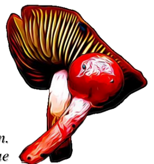
Cortinarius subgen. Dermocybe teresae

Phylum: Basidiomycota Clase: Agaricomycetes Orden: Agaricales Familia: Cortinariaceae Género: Cortinarius Subgénero: Dermocybe