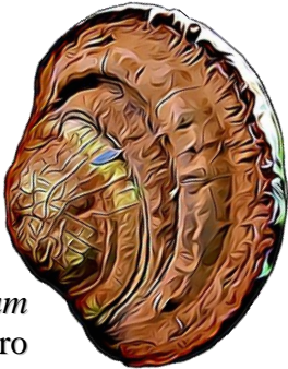
Ganoderma applanatum Yesquero

Phylum: Basidiomycota Clase: Agaricomycetes Orden: Polyporales Familia: Ganodermataceae Género: Ganoderma