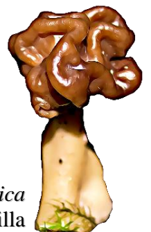
Gyromitra antarctica Falsa morilla

Phylum: Ascomycota Clase: Pezizomycetes Orden: Pezizales Familia: Discinaceae Género: Gyromitra